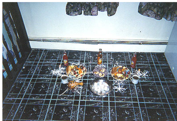
Offertorio per i Marassa

L' offertorio NON deve assolutamente contenere verdure nè ogni genere di alimento 'a fogliame', ciò verrebbe considerato dai Marassa un grave affronto. Alla fine del loro rito, i 'doni' devono essere distribuiti finchè l' offertorio non é completamente pulito.